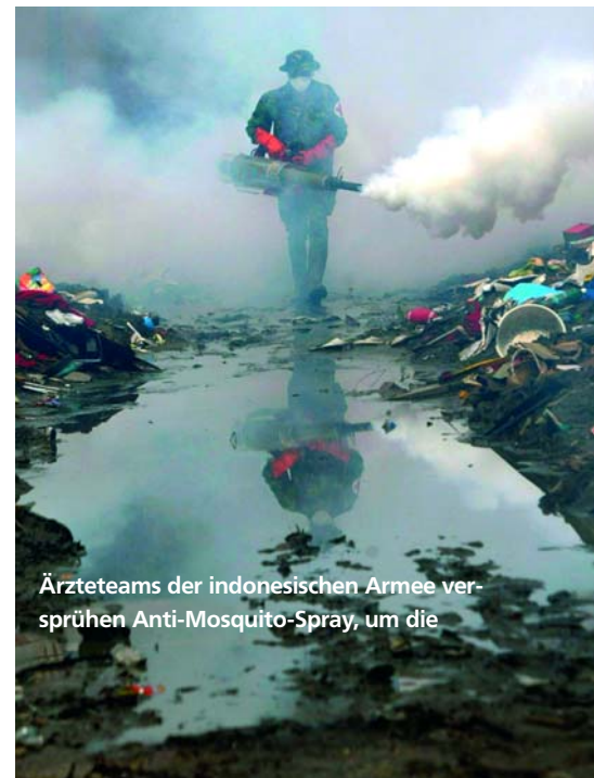
Ärzteteams der indonesischen Armee versprühen Anti-Mosquito-Spray, um die

Details dieser „Tsunami-Bombe“ sind veröffentlicht in 53-Jahre alten Dokumenten des Außenhandelsministerium von Neu Seeland, bekannt unter dem Namen „Projekt Seal“.