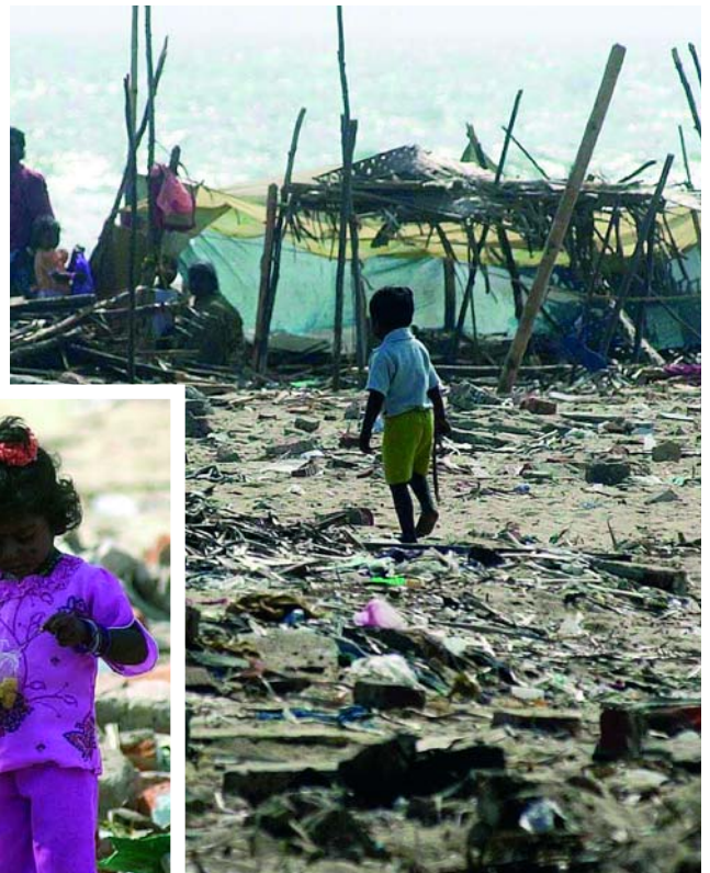
Ein Leben in Trümmern und Notbehausungen in Indien.

Um die Sache für Nicht-Techniker zu vereinfachen: Ein Erdbeben wird immer von einer e-lektromagnetischen Resonanz-Frequenz im Bereich von 0,5 – 12 Hertz (= Schwingungen pro Sekunde) ausgelöst, die aber kein einzelnes Augenblicks-Ereignis ist, sondern es muß sich um eine exakte Resonanz-Frequenz (während einer gewissen Zeitspanne) handeln. Wenn also echte Resonanzen auftreten, beginnen die Bruchlinien (von Erdschollen) zu vibrieren