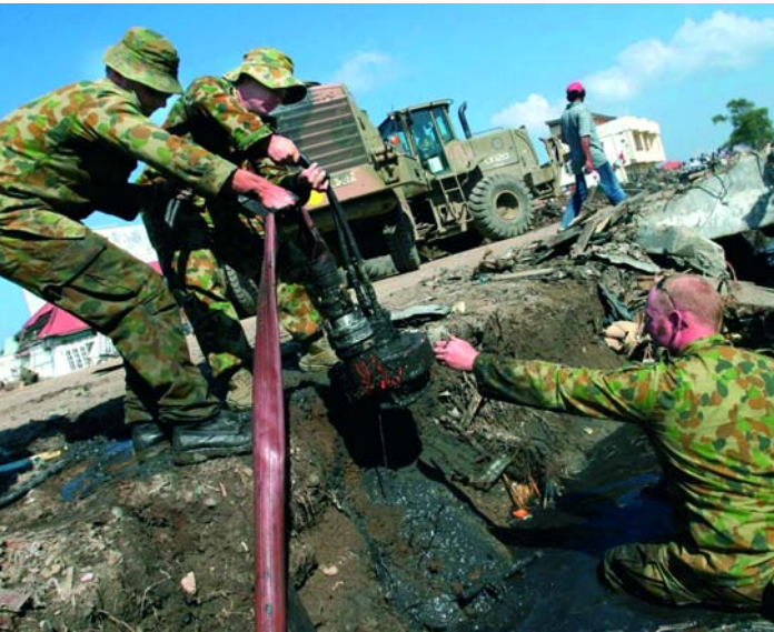
Australische Soldaten kümmern sich um die Wasserversorgung.