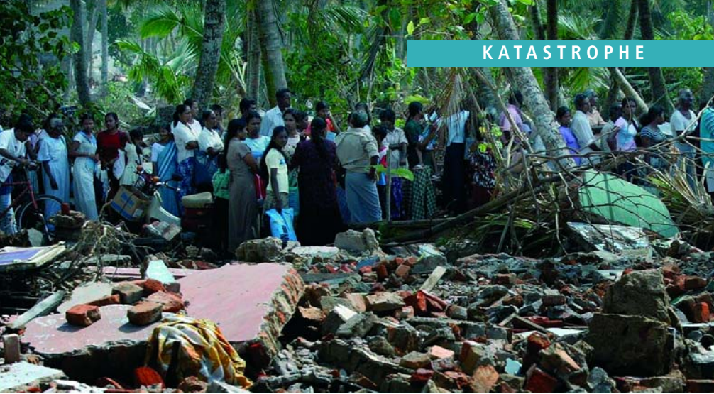
Die Tsunami-Opfer stehen Schlange bei der Verteilung von Hilfsgütern in Sri Lanka.

ren, ähnlich wie eine unter Spannung stehende Saite (einer Violine z.B.), wobei damit zugleich Warnungen an die Seismographen in Form von stetig ansteigenden transversalen Scher-Wellen ausgesendet werden.