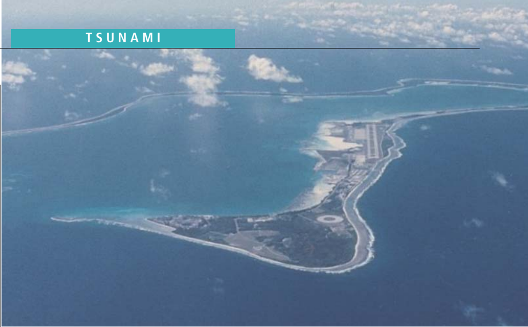
Die Insel der USA-Basis Diego Garcia blieb unversehrt.

Wenn alles nach Plan gegangen sein wird, hängen Indonesien, Sri Lanka und Indien am Hacken der IWF und der Weltbank für weitere dreißig und mehr Jahre – genug Zeit um zu warten bis der Ölpreis nach dem tödliche Fiasko im Irak wieder gefallen sein wird. Zur selben Zeit, wenn Indien den Köder geschluckt haben wird, würde die tödliche Koalition von Rußland-China-Indien und Brasilien abgesoffen sein. Kein schlechtes Tages-