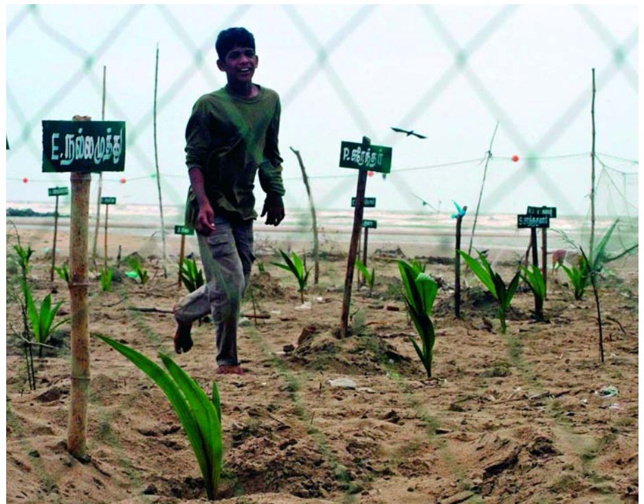
Auf dem Massengrab an der Küste von Indien wurden Kokospalmen gepflanzt. Jeder Steckling erhielt einen Namen...

Als dann die beiden Kampfgruppen (offensichtlich) in zwei verschiedene Richtungen des einsamen Indischen Ozeans fuhren, passierte ein