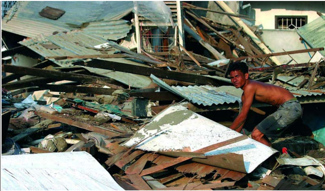
Ein Mann durchsucht die Ruinen seines zerstörten Hauses. Indonesien ist von der Verwüstung am stärksten betroffen. Es gibt unzählige Obdachlose und mehr als 40% der Kinder verloren ihre Familien durch die Katastrophe.